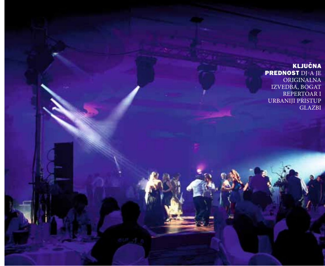
KLJUČNA PREDNOST DJ-A JE ORIGINALNA IZVEDBA, BOGAT REPERTOAR I URBANIJI PRISTUP GLAZBI

“Nove ploče i cd-e kupujem i dan danas, najčešće preko eBay-a jer je tamo najveći izbor. Hrvatsko tržište je posve zanemarilo format 12” maxi-singla te u novije vrijeme CD-singla. Na spomenutim formatima nalaze se produžene i razne klupske verzije pjesama s kojima DJ postiže bolju kvalitetu programa, ali kao što rekoh, dostupne su samo u inozemstvu ili preko interneta. Mogao bih se pohvaliti zaista velikom brojkom originalnih CD-a i vinila, no na samom